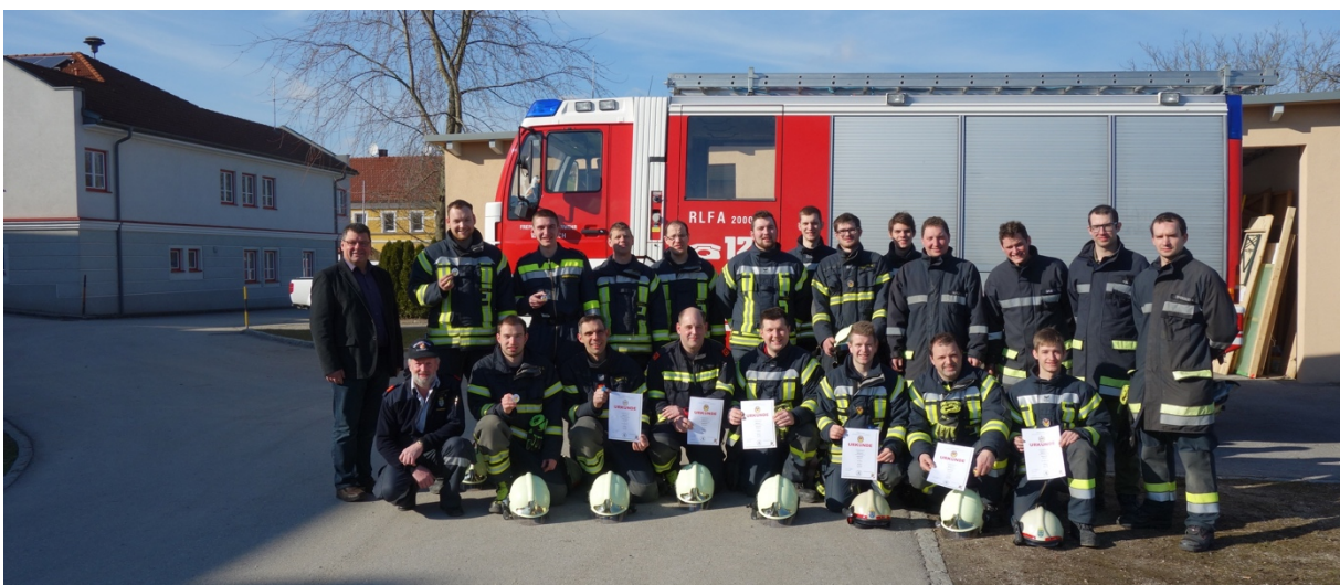
Urkundenverleihung Ausbildungsprüfung Atemschutz