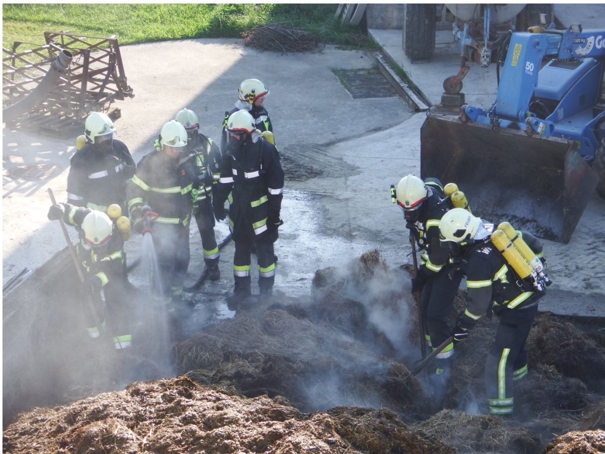
Misthaufenbrand am 17.05.2017 in Hartlmühl