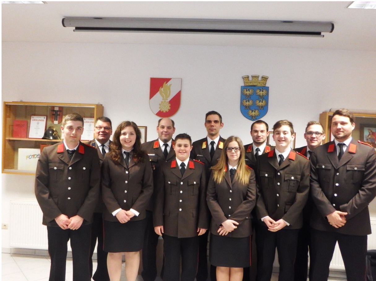
Angelobung JHV 2016