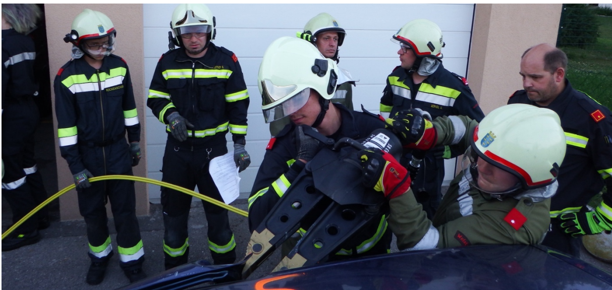
Übung mit dem neuen hydraulischen Rettungssatz am 06.07.2017