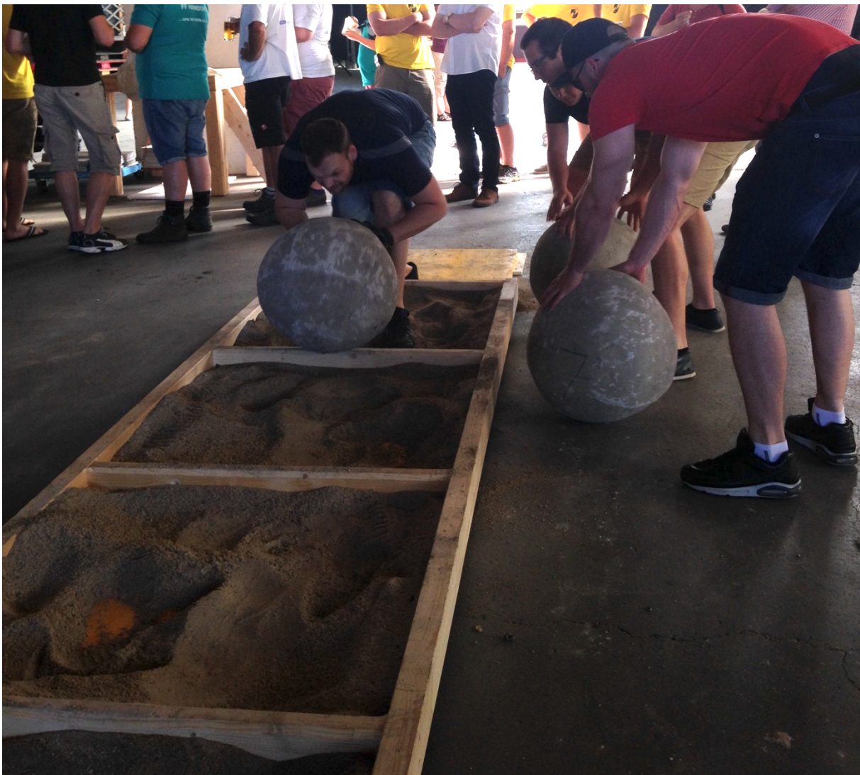
Strongman Meilersdorf am 10.06.2017