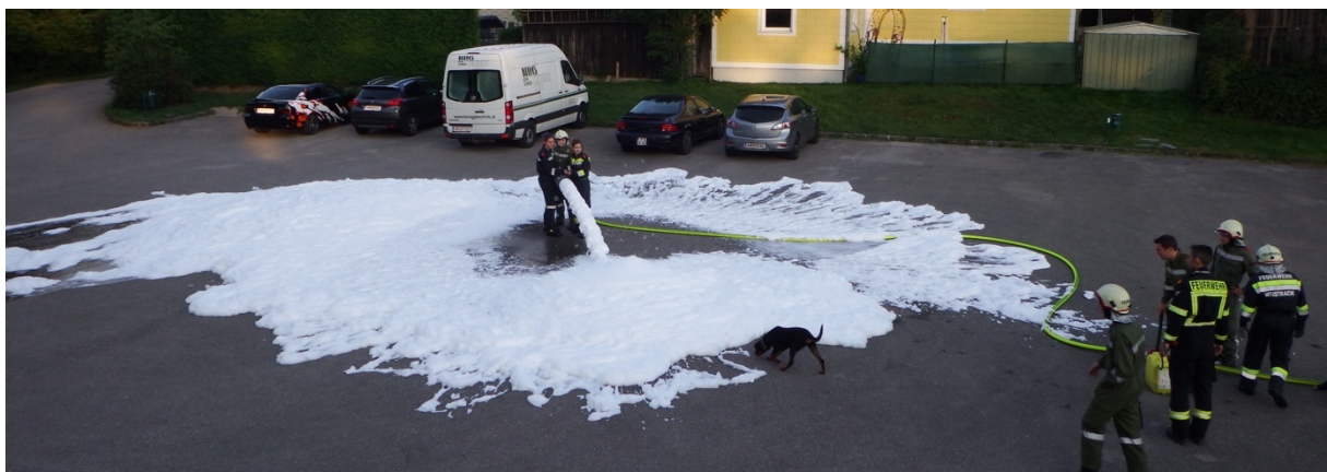
Gruppenübung Gruppe 5 und 6