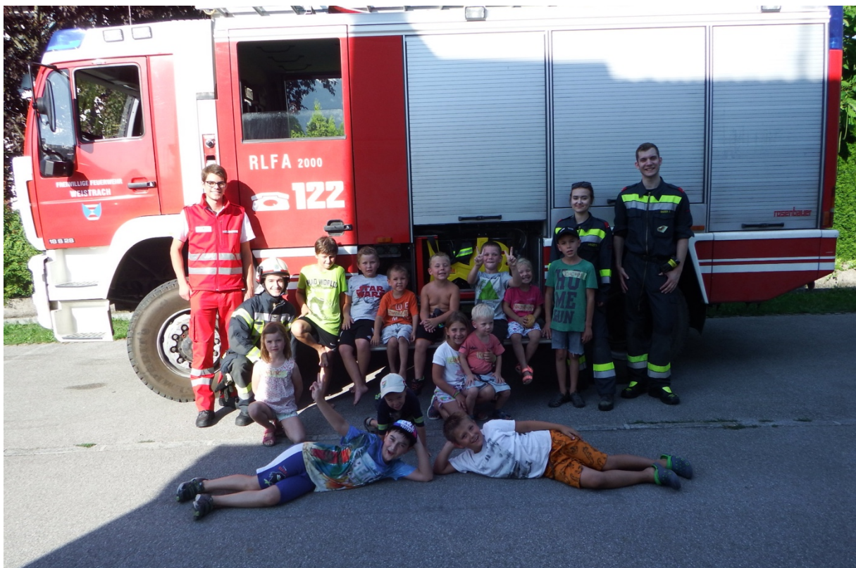
Kinderferienprogramm am 22.07.2017