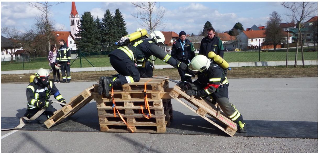
Hindernisstrecke Ausbildungsprüfung Atemschutz

Ich weiß, dass das Thema Schadstoff nicht das interessanteste ist, jedoch freut es mich, wenn sich immer wieder Kameradinnen und Kameraden für Gerätetraining und Planspiele Zeit nehmen. Dafür möchte ich mich bedanken.